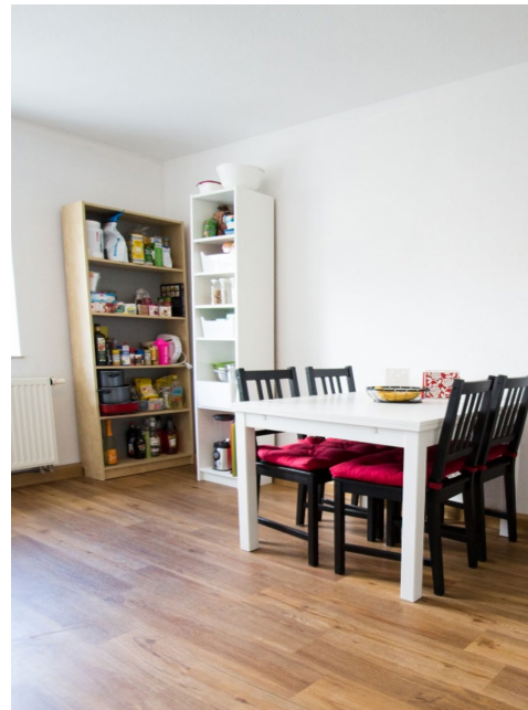
WGs für Auszubildende